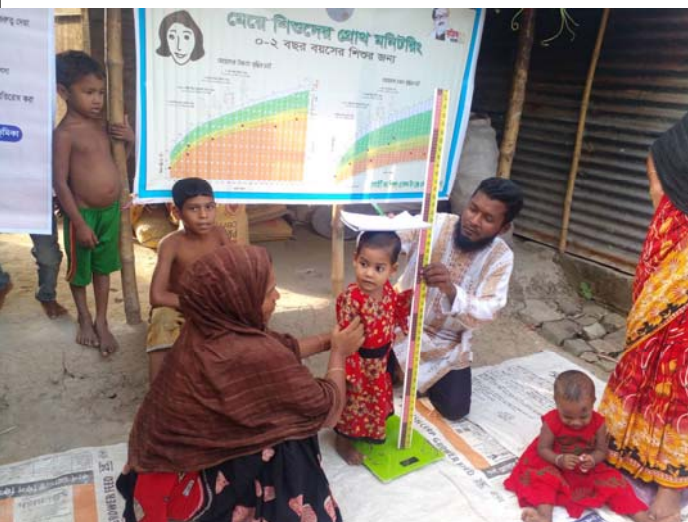
Monitoraggio della crescita dei bambini di villaggio. Il progetto "Igiene e Salute nel Barind" è sostenuto per l'anno 2022 con i fondi Otto per Mille della Chiesa Valdese

Nel 2023 proseguirà poi il nostro impegno nelle scuole del territorio, in particolare con i progetto "Regione 4.7 - Territori per l'Educazione alla Cittadinanza Globale" (capofila Regione Piemonte) e "Lasciamo il segno...non l'impronta!" . Quest'ultimo, sostenuto con i Fondi Otto per Mille della Chiesa Valdese, ha l'obiettivo di diminuire l'impatto ambientale di 2