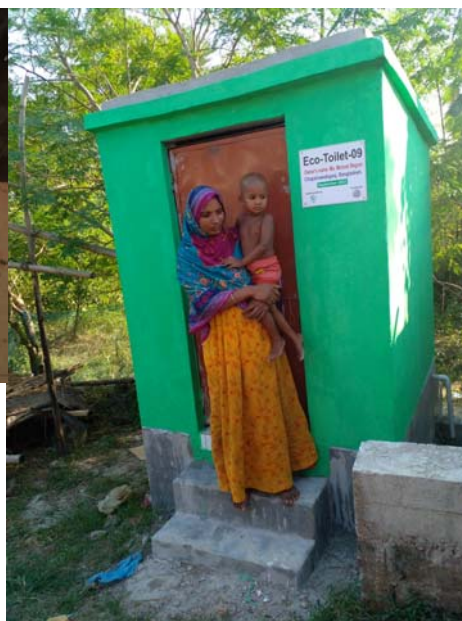
Una beneficiaria del progetto "Igiene e Salute nel Barind" ritratta con il figlio davanti alla sua eco-toilet.

Istituti scolastici per contrastare il cambiamento climatico (OSS 13), puntando in particolare su gli OSS 11 (Città e comunità sostenibili) e 12 (Consumo e produzione responsabili). Partendo da questo obiettivo specifico e riflettendo sull'importanza di coinvolgere i giovani nel raggiungimento degli OSS dell'Agenda2030, Ashar Gan ha scelto di lavorare con gli studenti del pinerolese, puntando alla loro attivazione. L'idea è di formare per ciascuna scuola coinvolta un "Ufficio Sostenibilità" gestito dagli studenti, che si occupi di rendere più sostenibile la propria scuola, partendo dal suo impatto attuale per certi aspetti specifici (mobilità, consumo energetico, idrico, plastica ecc.) per puntare ad una sua riduzione attraverso azioni concrete da mettere in atto direttamente o da proporre (alla dirigenza scolastica, al Comune, alla Provincia). OSS 11-12-13-17